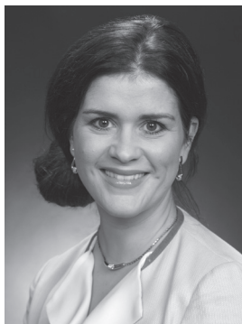
ÞÓRDÍS KOLBRÚN R. GYLFADÓTTIR ferðamála-, iðnaðar- og nýsköpunarráðherra 4. þm. Norðvesturkjördæmis Sjálfstæðisflokkur

Alþingismaður Norðvesturkjördæmis síðan 2016 (Sjálfstæðisflokkur).