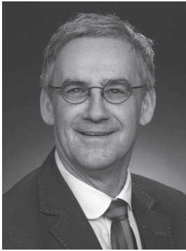
GUÐJÓN S. BRJÁNSSON 8. þm. Norðvesturkjördæmis Samfylkingin

Alþingismaður Norðvesturkjördæmis síðan 2016 (Samfylkingin).