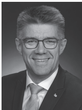
GUNNAR BRAGI SVEINSSON 2. þm. Norðvesturkjördæmis Framsóknarflokkur

Alþingismaður Norðvesturkjördæmis síðan 2009 (Framsóknarflokkur).