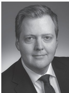
SIGMUNDUR DAVÍÐ GUNNLAUGSSON 2. þm. Norðausturkjördæmis Framsóknarflokkur

Alþingismaður Reykjavíkurrkjördæmis norður 2009–2013, alþingismaður Norðausturkjördæmis síðan 2013 (Framsóknarflokkur).