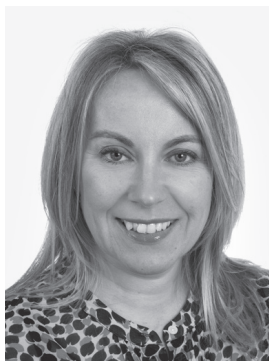
SIGRÍÐUR Á. ANDERSEN dómsmálaráðherra 8. þm. Reykjavíkurkjördæmis suður Sjálfstæðisflokkur

Alþingismaður Reykjavíkurkjördæmis suður síðan 2015 (Sjálfstæðisflokkur).