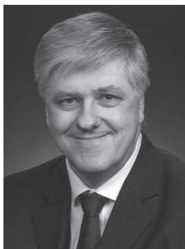
BENEDIKT JÓHANNESSON fjármála- og efnahagsráðherra 10. þm. Norðausturkjördæmis Viðreisn

Alþingismaður Norðausturkjördæmis síðan 2016 (Viðreisn). Fjármála- og efnahagsráðherra síðan 2017.