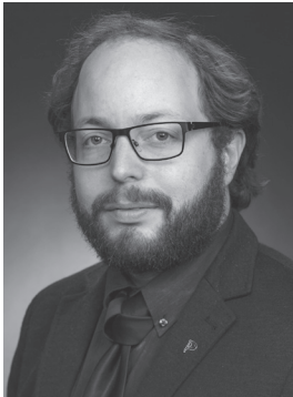
SMÁRI MCCARTHY 4. þm. Suðurkjördæmis Píratar

Alþingismaður Suðurkjördæmis síðan 2016 (Píratar).